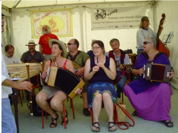
In ons tentje op het festivalterrein...

Het feest in Carcassonne is weeral voorbij .... Hopelijk mogen we er volgend jaar weer bij zijn. Een verslagske van onze ervaringen komt binnenkort op de website met heel wat foto's.